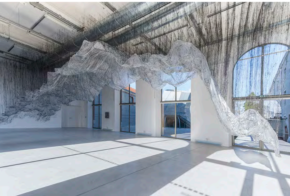
2015: RELIEF(S) / Les Turbulences (Frac Centre, オルレアン, フランス)