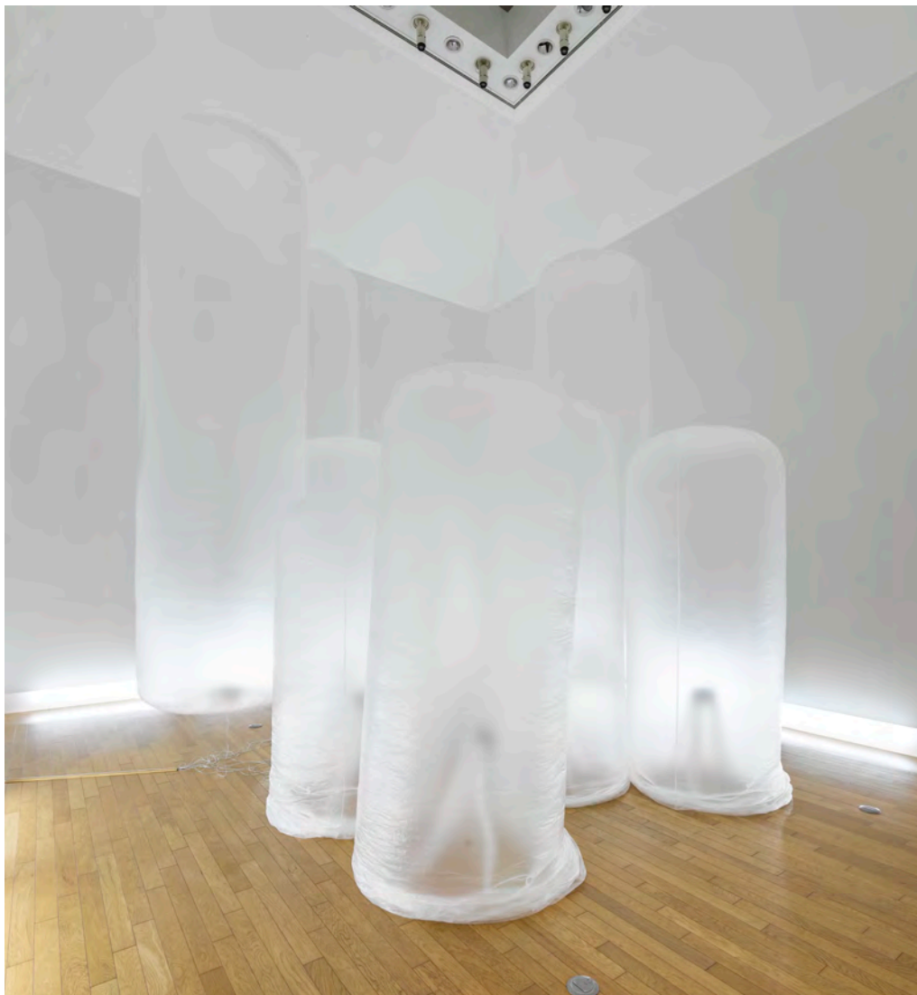
2015: 咲くやこの花コレクション 空洞の彫刻 (アートコートギャラリー、大阪)